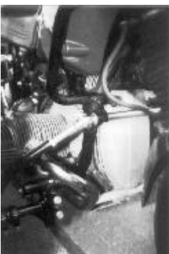
Die Hilfsrahmenkonstruktion ist nicht aufregend, sondern einfach und funktionsfähig

Zur Ehrenrettung des Umbaus muß man jedoch sagen, daß solche Kapriolen nicht zum Repertoire des Besitzers gehören. Eine dem Umbaukonzept angepaßte Fahrweise sollte man sich generell zulegen.