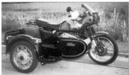
Die rote GS, ein Serienmotorrad mit Beiwagen, das tatsächlich wahlweise benutzt wird. Bei der Anreise in die Alpen wird der Beiwagen als Gepäcktransporter verwendet, ohne drittes Rad geht es dann über verlassene Militärstraßen auf einsame Alpengipfel.